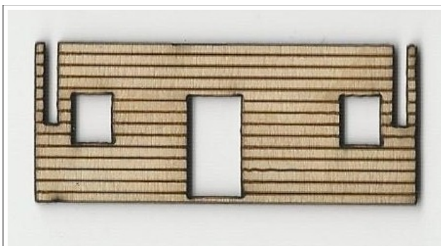
Incisione su compensato di betulla

La lavorazione può venir eseguita su ogni genere di materiale: cartone, plexiglas e legno.