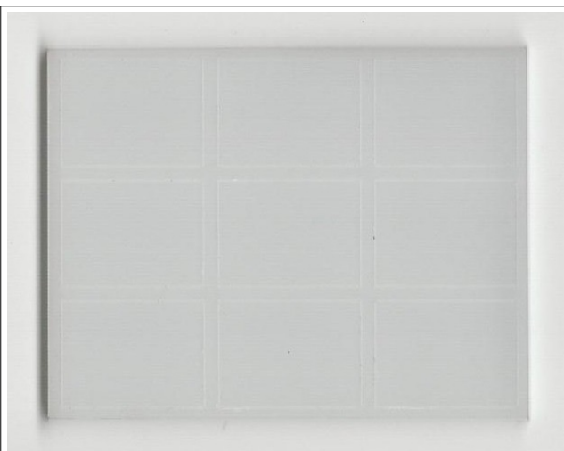
Incisione su plexiglas opalino